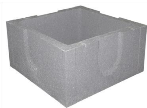
Caixa de Visita